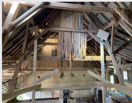
Einst die Heubühne - der filigrane Dachstock des ehemaligen Ökonomieteils.

Die Arbeitsvorbereitung ist beim Umbau des denkmalgeschützten Objekts besonders wichtig, denn auf dem Bauplatz gibt es keinen Handyempfang. Das ehemalige Bauernhaus steht nicht im Siedlungsgebiet.