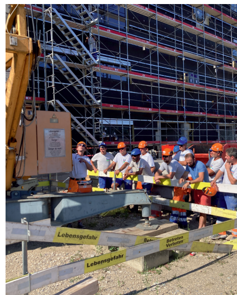
Bild von der Kranführerschulung.

Unsere Kranführer wurden in den wichtigsten Bedien- und Wartungsarbeiten in Theorie und Praxis geschult. Zum Beispiel war das Anfahren und Prüfen der Endschalter ein Thema oder die Frage, wann ein Hubseil als beschädigt gilt. Die Ausbildung wurde durch Spezialisten der Liebherr-Baumaschinen AG, Reiden, begleitet.