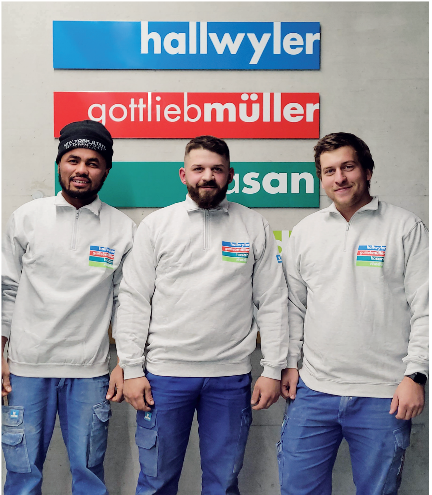
Unsere Schalungsgruppe «Breite».

Informationsschrift für Partner und Mitarbeiter der Hallwyler Unternehmungen AG. Ausgabe 2/22